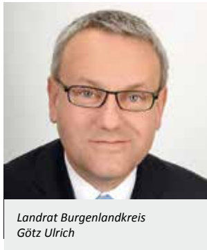
Landrat Burgenlandkreis Götz Ulrich