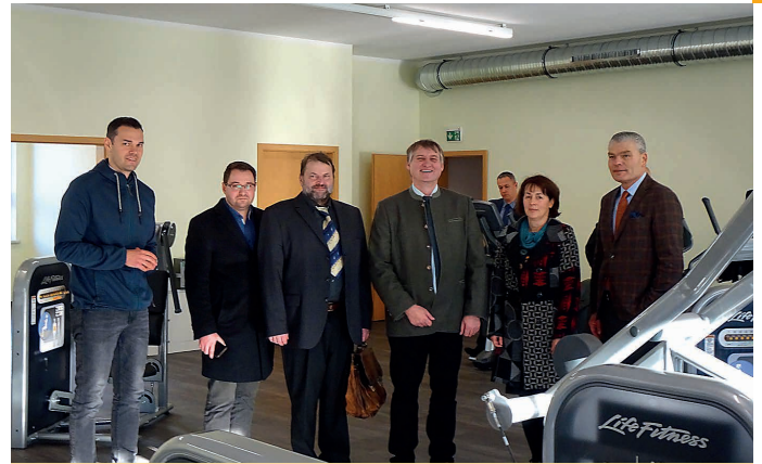
Foto 7: Vertreter d. Landes- u. Kommunalpolitik im Gesundheitssportzentrum Bad Dürrenberg

Nach einer Bauzeit von ca. 20 Monaten konnte die Erweiterung des Gesundheitssportzentrums Bad Dürrenberg am 3. Dezember feierlich im Beisein von Holger Stahlknecht, Minister für Inneres und Sport des Landes Sachsen-Anhalt, MDL Frank Bommersbach, dem stellvertretenden Landrat Hartmut Handschak, dem Bürgermeister Christoph Schulze und weiteren Vertretern aus Politik und Wirtschaft eröffnet werden. Die ständig wachsende Nachfrage in den Bereichen Fitness, Rehasport, Kindersport und Präventionssport für körperlich und geistig Benachteiligte erforderte die räumliche Erweiterung des Zentrums sowie die Erweiterung der Ausstattung mit Sportgeräten. So wurde die vorhandene Fläche um 140 m 2 auf ca. 450 m 2 vergrößert und vollständig ebenerdig, barrierefrei und räumlich als ein zusammengehöriger Komplex, einschließlich Sanitärräume eingerichtet. Die Gäste konnten sich an diesem Tag von der gelungenen Umsetzung dieses Projektes überzeugen.