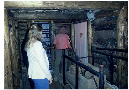
Foto 3: Besichtigung des Bergbaumuseums zur Sitzung der LAG MRS in Deuben