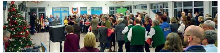
Foto 11: Tag des Ehrenamtes

Der LEADER-Informationsstand war an diesem Abend rege besucht.