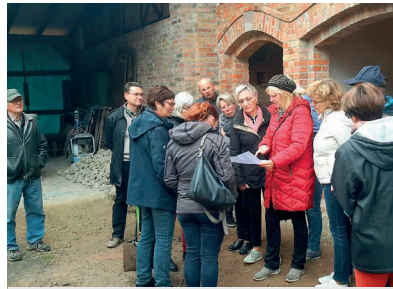
Foto 2: Besichtigung des zukünftigen Museumshofes durch die Mitglieder der LAG SUT in Großjena