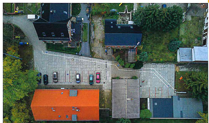
Sicherer Schulweg durch Umgestaltung und Neuordnung der Fläche

Mit der Umgestaltung und Neuordnung wurde die Fläche befestigt und gleichzeitig eine Abgrenzung zwischen Fahrbahn, Fußweg und Parkfläche geschaffen. So wird den Kindern ein sicherer Schulweg über diesen Bereich ermöglicht und die Parkflächen wurden neu geordnet.