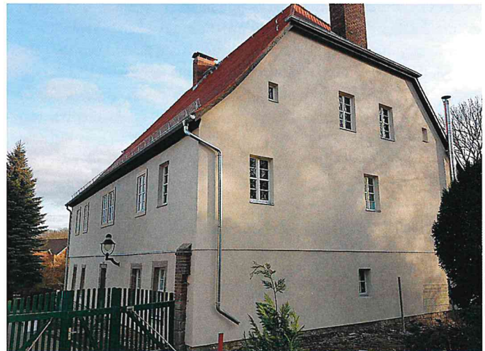
Umnutzung ehemaliges Pfarrhaus Taucha nachher