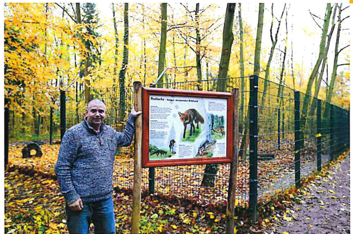
Tier- und Erlebnispark Karl-Louis Martzsch in Lützen

Der Tier- und Erlebnispark Karl-Louis Martzsch mit einer Fläche von ca. 13 Hektar, seinem Tiergehege, den vielen kleinen Wanderwegen, seltenen Bäumen und Sträuchern, ist ein kulturhistorisches Kleinod im Gesamtensemble der Gustav-Adolf-Gedenkstätte in Lützen. Ganzjährig finden die zahlreichen Besucher hier Erholung und Entspannung in der Natur. Kinder und Jugendliche werden an die Belange der Umwelt-, des Tier- und Naturschutzes herangeführt. Die sportliche Betätigung sowie die Möglichkeit des naturnahen Erlebens der Tier- und Pflanzenwelt auf den bereits angelegten verschiedenen Naturpfaden erfreuen sich großer Beliebtheit bei den Besuchern. Mit Unterstützung durch die LEADER-Förderung konnten in diesem Jahr die Zaunanlagen von zwei Wildgehegen erneuert und dem heutigen Standard angepasst werden. Weitere Informationen erhalten Sie unter: www.tierpark-luetzen.de