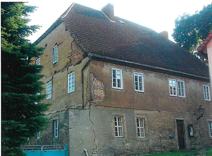
Umnutzung ehemaliges Pfarrhaus Taucha vorher

sollen Leben und Arbeiten unter einem Dach stattfinden. Die Innensanierung erfolgte durch die Familie selbst. Mit Hilfe der LEADER-Förderung konnten das Dach und die Fassade des großen Hauses denkmalgerecht saniert werden.